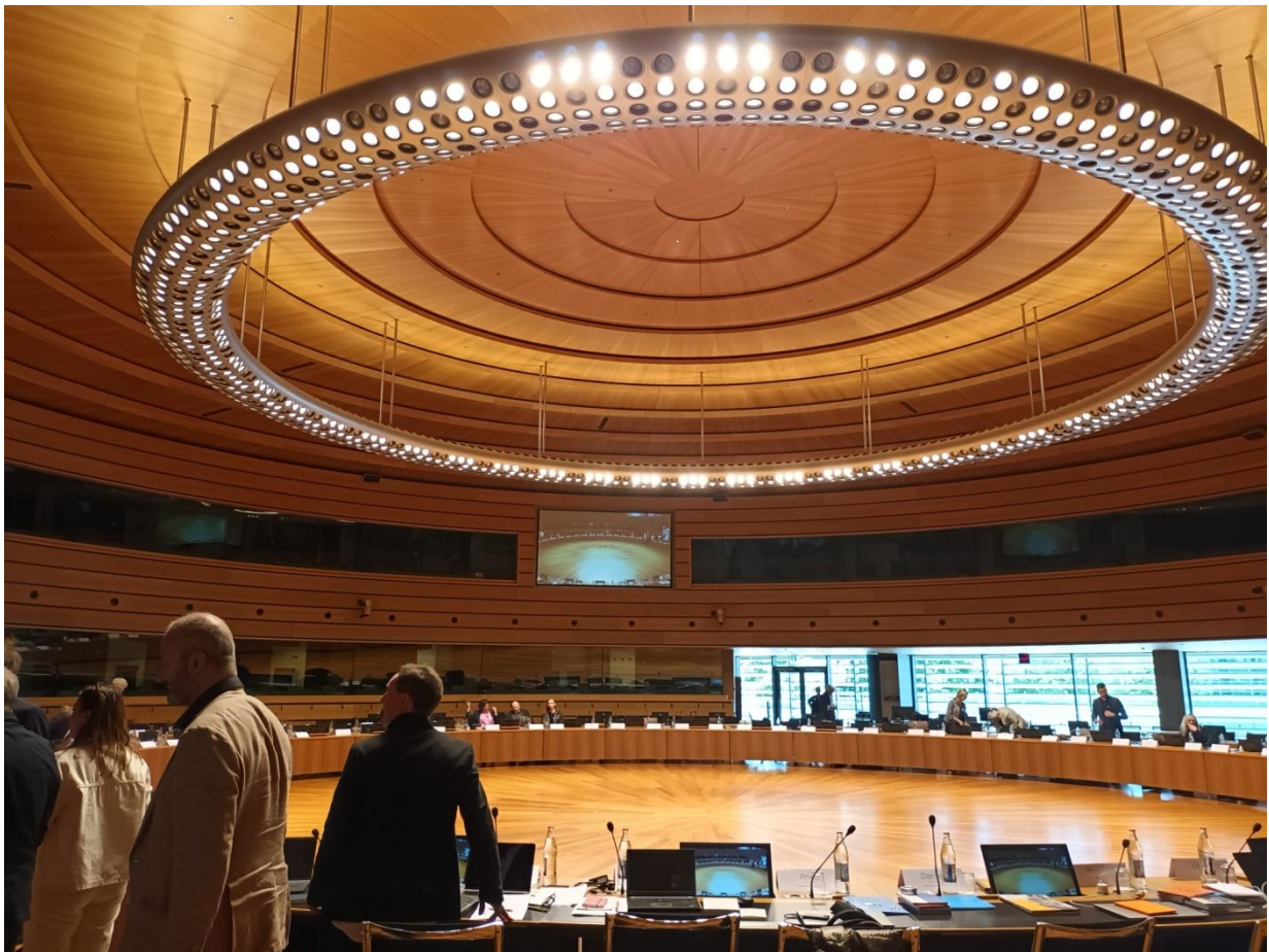
Информацията подготви арх. Истелианна Атанасова