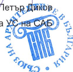
Арх. Петър Диков Председател на УС на САБ